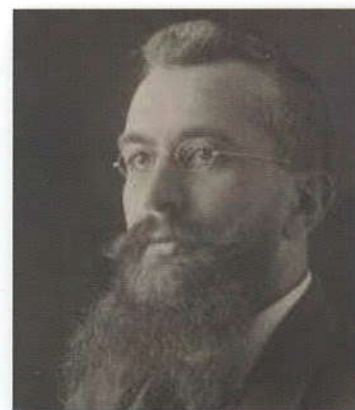
Giuseppe Lombardo Radice (1879-1938).