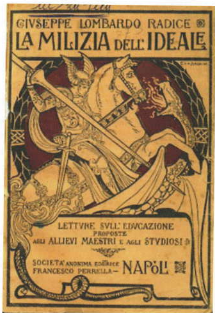
Giuseppe Lombardo Radice, La milizia dell'ideale , 1913. Copertina di Ezio Anichini.

tile, la ricerca dei collaboratori, dei direttori di sezione, degli autori delle voci più importanti. In mezzo a tutto ciò, risuona come un assolo gonfio di delusione, preoccupazione e dignità il "no" di Lombardo Radice. Fuori dal protocollo accademico e redazionale, probabilmente anche in nome della