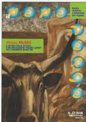
Copertina di Duilio Cambellotti, I buoi, 1914, part.