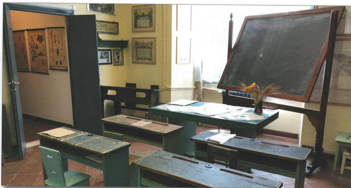
MuSEd, attuale ricostruzione di un'aula delle scuole per contadini dell'Agro Romano.

Per quanto concerne il primo ambito, nel 2002 il MSD acquisisce la raccolta di libri e oggetti scolastici appartenenti all'Istituto di Santa Maria in Aquiro. Con riferimento all'opera di catalogazione informatica del patrimonio museale, vengono invece effettuate: a) la schedatura, l'ordinamento e l'inventariazione dell'archivio dell'Ente per le