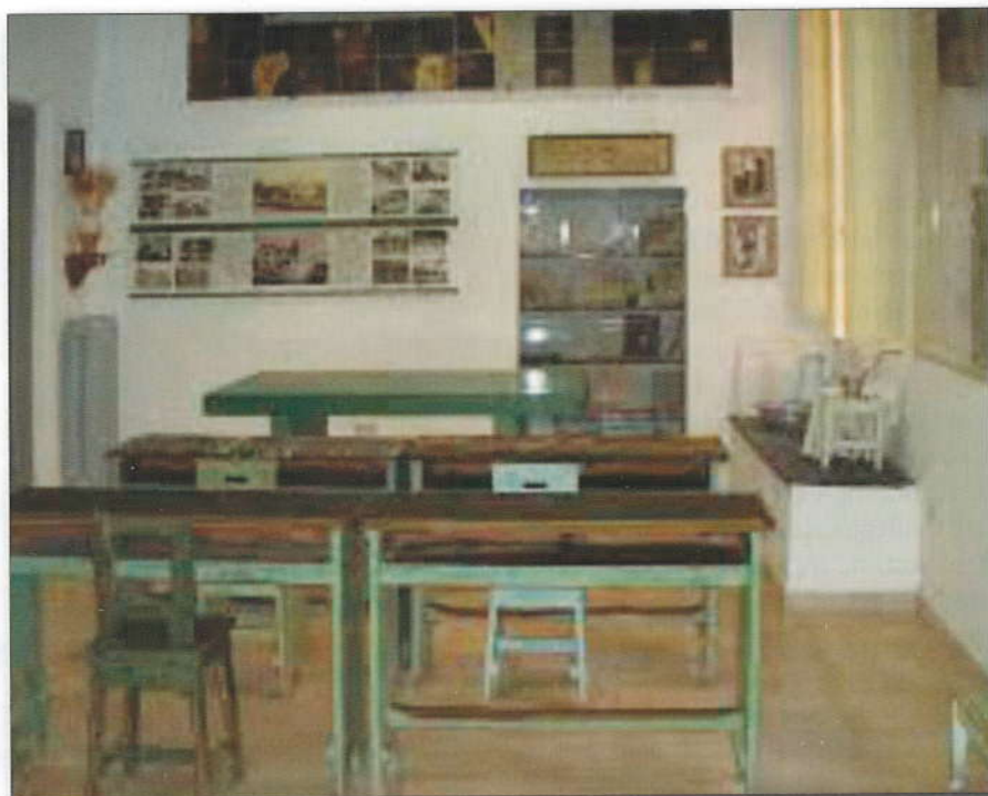
Aula di una scuola per contadini dell'Agro Romano nel precedente allestimento del MuSEd.