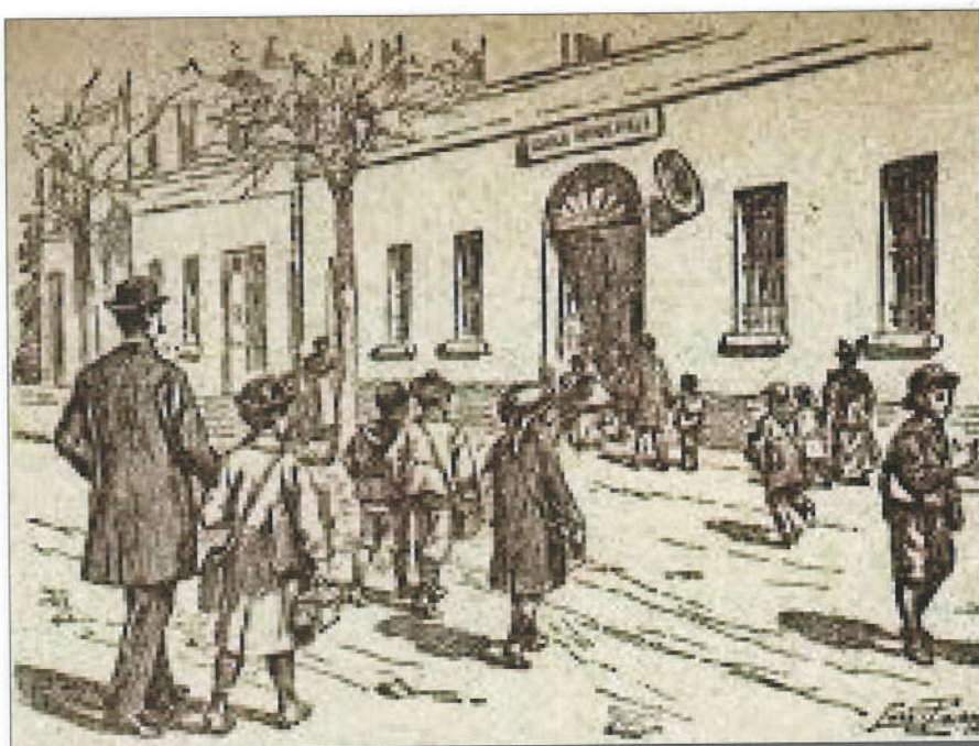
Immagine del Museo pedagogico di Credaro.

In conseguenza della soppressione del MIE (1891), il patrimonio librario viene incorporato dalla Biblioteca Alessandrina, mentre i materiali museali vengono collocati in alcuni locali dell’Università di Roma, dove rimangono – praticamente abbandonati e dimenticati – per circa un decennio,