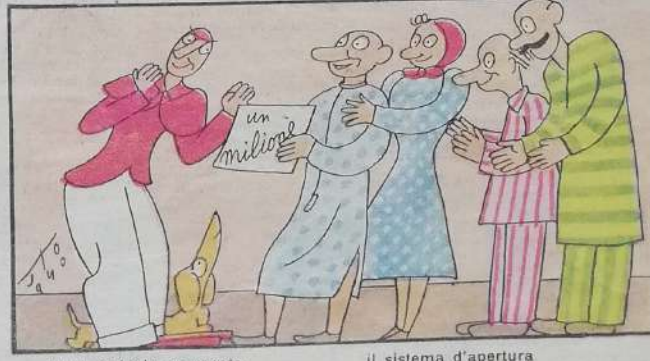
8. Il pericolo scampato, premia il capofabbricato

il sistema d'apertura del signor Bonaventura!