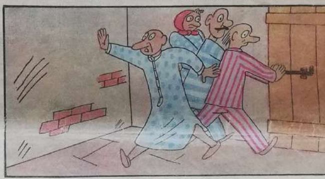
4. Anche gli altri senza indugio si dirigono al rifugio,

con quel carico ingombrante scende a passo barcollante.