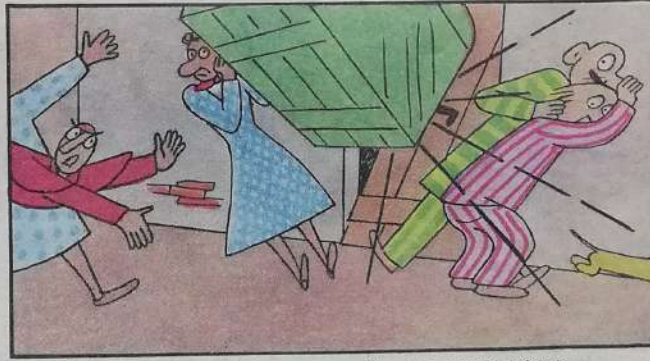
6. E quel bolidé tremendo sulla porta ricadendo

prende tale un inciampone che rovesciasì il cassone.