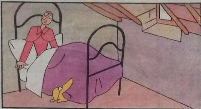
1. Qui comincia la sventura del signor Bonaventura

che svegliato è a notte piena dall'urlar della sirena.