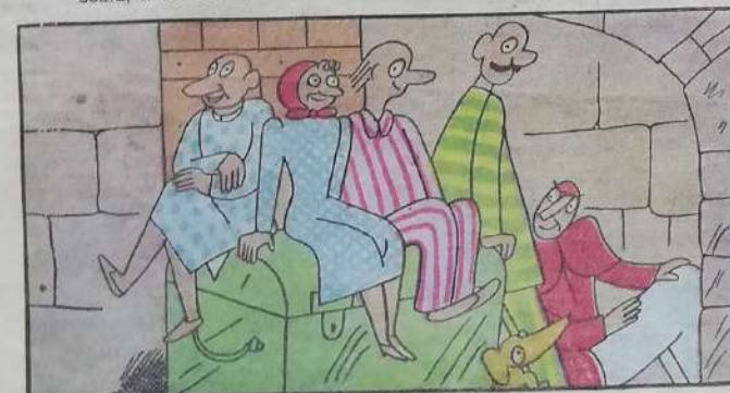
7. Quella gente è più sicura ora fra-le grossa mura:

il paletto manda infranto e spalancaia di schianto.