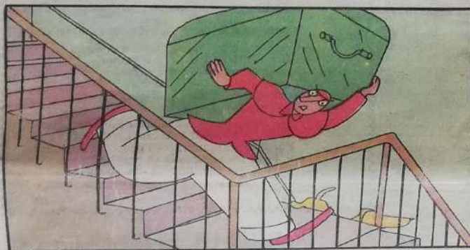
3. Dal suo piccolo abbaino poi, gradino per gradino,

il baule vuol salvare delle cose sue più care.