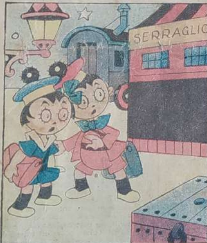
4. Ma nel buio essi van per isbaglio a passare vicino a un serraglio.