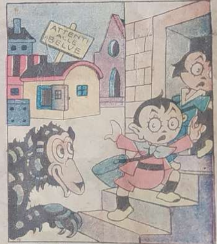
6. Dalla gabbia esce un nero orsacchiotto, che rincorre i piccini al gran trotto.