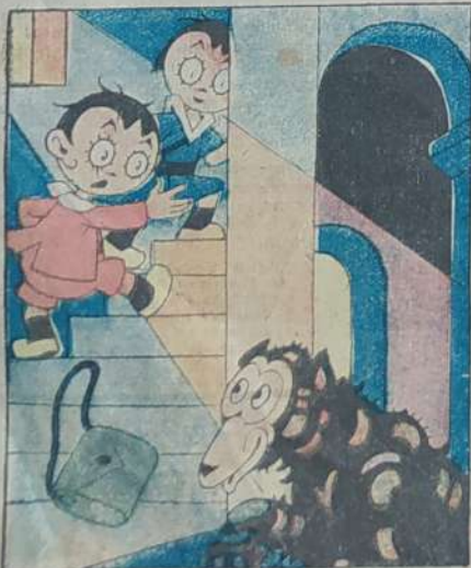
7. Saigon Pino e Pinuccia in un lampo sulla Torre cercando uno scampo.