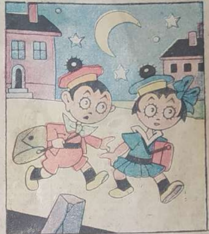
3. Verso scuola fratello e sorella s'incamminano a lume di stella...