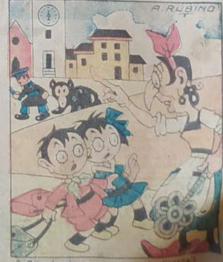
9. Quando giungono a scuola (o disegna) è già tardi e l'Argia non li accetta.