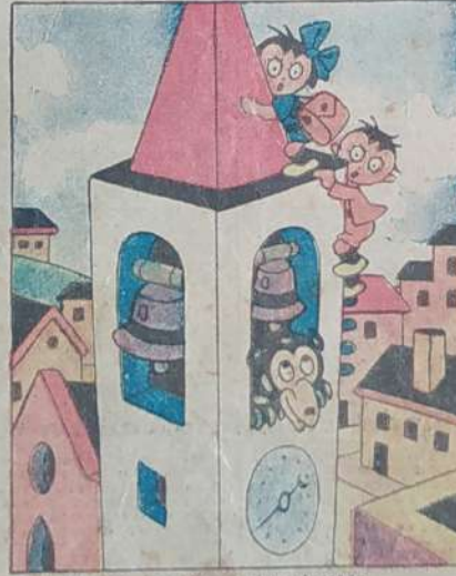
8. Salvi son, ma con ansia e terrore, son costretti a trascorrere l'ora.