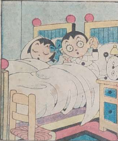
1. Pino passa la notte assai male, della sveglia aspettando il segnale.