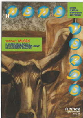
Copertina di Duilio Cambellotti , I buoi , 1914, part.