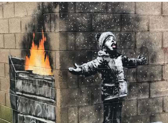
"Season's greetings"- Banksy