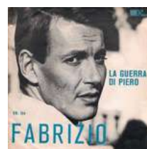
La guerra di Piero Fabrizio De Andrè