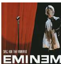
Sing for the moment Eminem