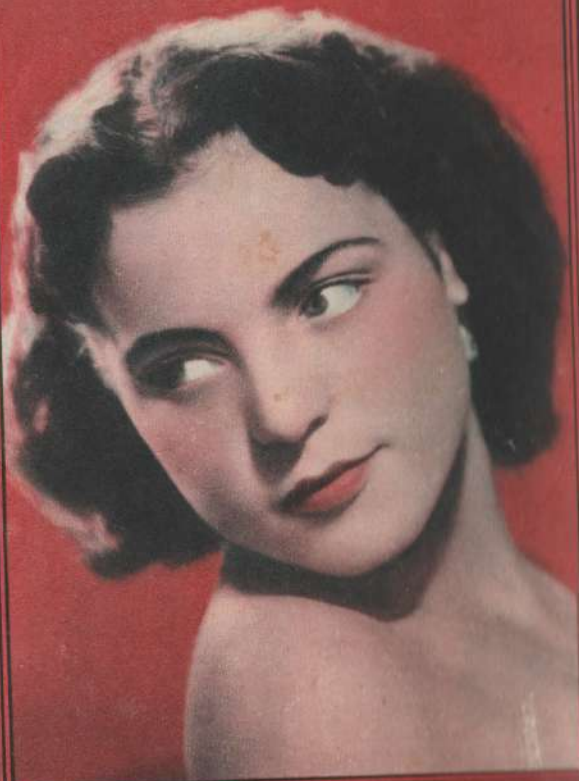
LA BELLA DI QUESTA SETTIMANA:

VOLETE ESSERE VOI LA BELLA DELLA PROSSIMA SETTIMANA? leggete le norme a pagina 2