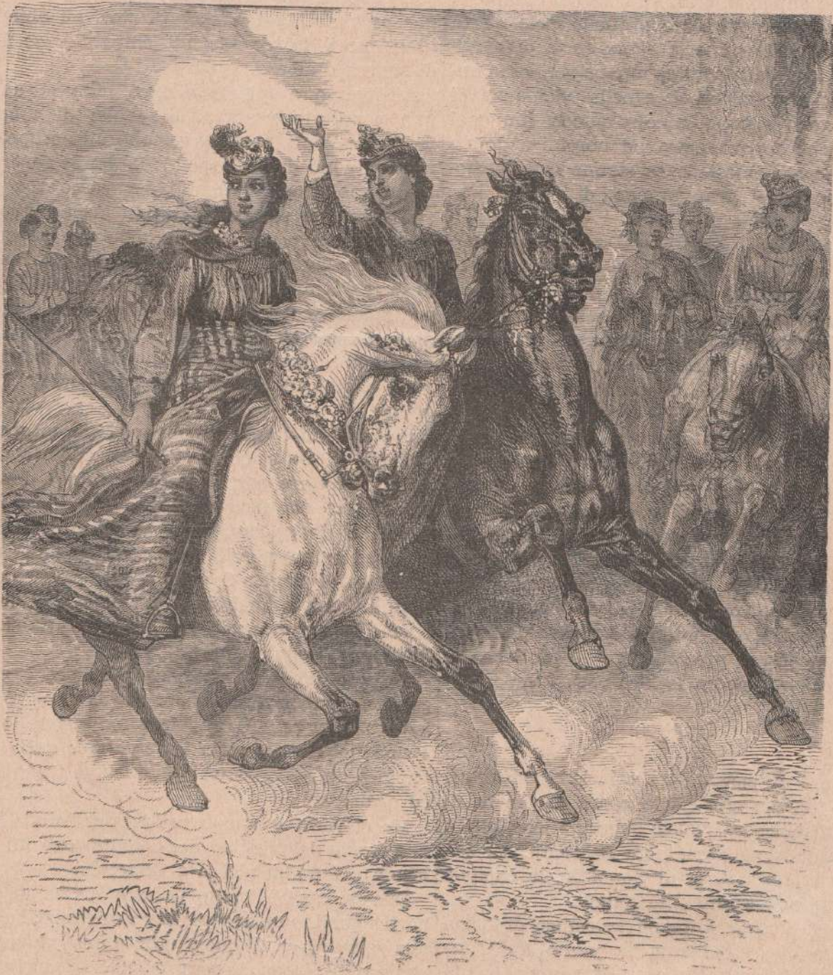
Cavalatrici delle isole Havai.

Le associazioni si ricevono presso i FRATELLI TREVES, editori, Milano, e le loro filiali a Bologna, Roma e Napoli.