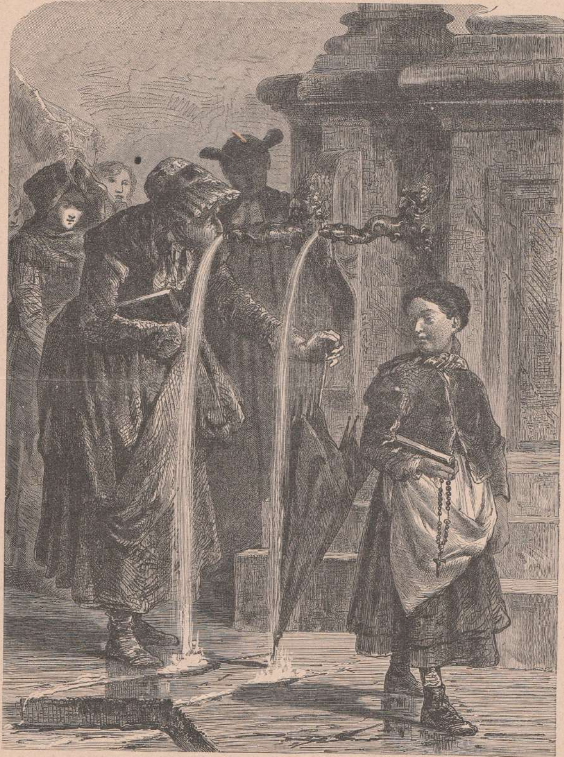
..... la bambina tenendo la sua corona in mano attendeva (pag. 310).

Mi trovavo a San Giovanni biellese da qual- verna naturalmente scavata nella roccia, che è che giorno. Avevo già visitata più volte la ca- stata nel 1870 ridotta a cappella, dove si venera