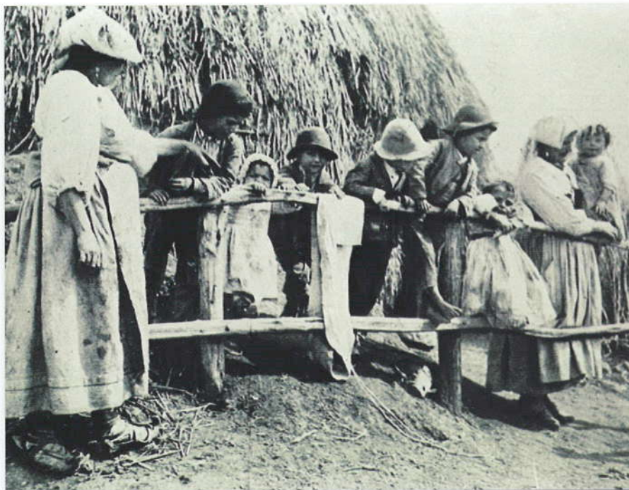
La vita nei villaggi dell'Agro Romano.

Angelo Celli, create le prime due stazioni sanitarie sperimentali antimalariche dell'Agro, una a Maccarese sulla via Aurelia e una presso la tenuta della Cervelletta, sulla via Collatina, diede inizio alla lotta contro la malaria tra i dipendenti delle ferrovie e tra i quitti ,