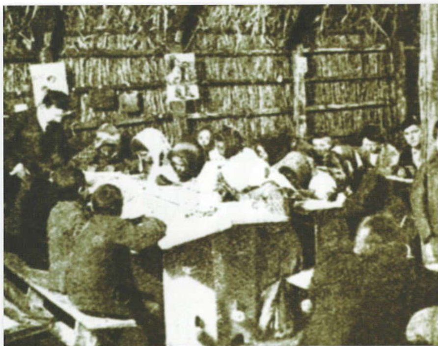
Interno della capanna-scuola a Colle di Fuori (1907).

Ma un grave ostacolo che impediva una rapida azione igienico-sanitaria era costituito dall'arretratezza culturale delle popolazioni agricole, dalle loro usanze primitive, dalle superstizioni, dalla diffidenza con cui accoglievano ogni forma di aiuto; per guarire dalle febbri malariche molte persone si affidavano preferibilmente a cure ridicole e ributtanti consigliate da ciarlatani o comari, e qualche