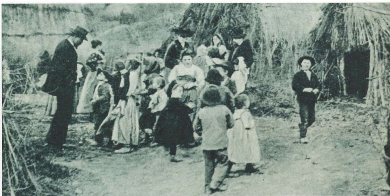
Visita a Lunghezza del Comitato per le scuole dell'Agro Romano (1907).

1900 organizzò l'assistenza sanitaria antimalarica nel territorio laziale con un servizio mobile di soccorso, e provvedendo a fornire i medici, gli infermieri, i carri ambulanza, le barelle per il trasporto dei malati, i medicinali e quant'altro era necessario.