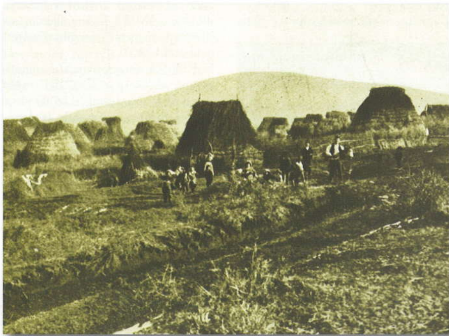
Il villaggio di San Cesareo nell'Agro Romano.

Le scoperte scientifiche del 1898, che stabilivano la vera natura della infezione malarica e attribuivano alla zanzara anofele le cause della sua trasmissione all'uomo, permisero di combattere la malattia con appropriati sistemi di cura e di prevenzione e di potere avviare nella Campagna romana quel processo di risanamento e di ripresa economica tanto atteso.