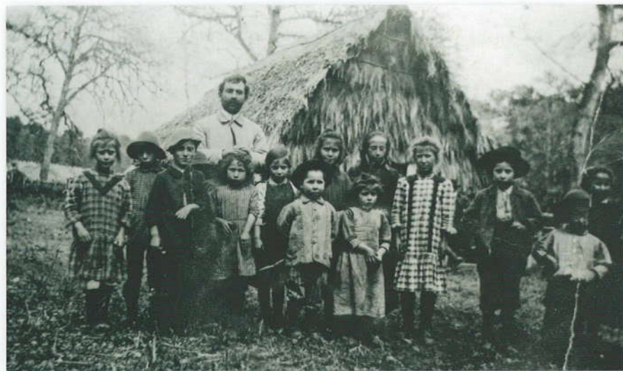
Scuola nella lestra ad Arduino.

A partire dall'anno scolastico 1907-1908, per rendere più organica ed efficace l'azione educativa ed estendere in