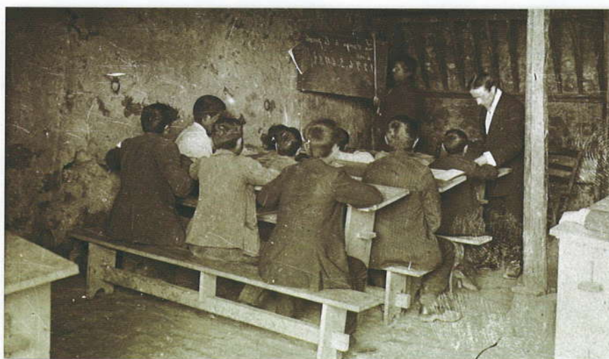
La lezione in una stalla (1908).