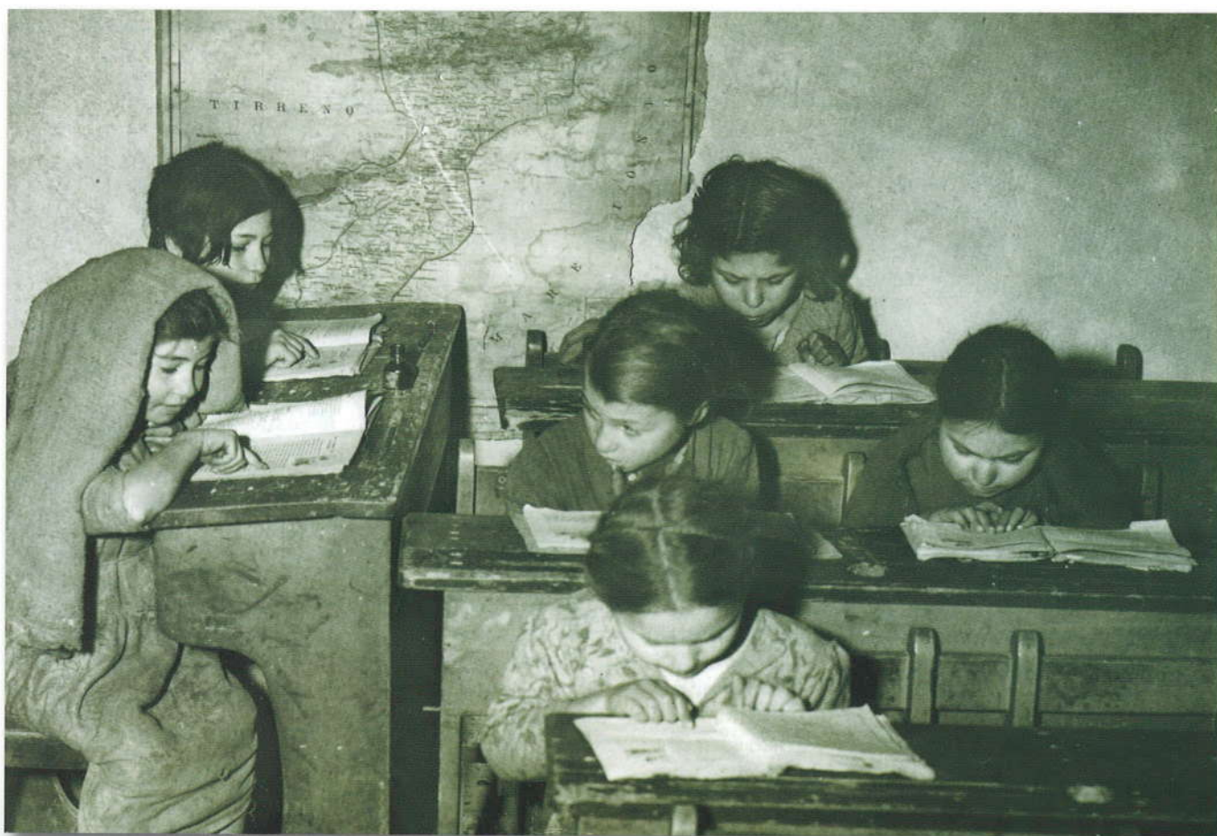
Alunne di una scuola rurale.