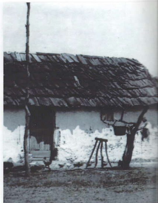
Villaggio di Iestre nell'Agro Pontino.

Sino alla fine dell'Ottocento, tra i tanti problemi che le amministrazioni di Roma succedutesi dopo l'Unità, si trovarono ad affrontare, figurava quello della lotta alla malaria che mieteva numerose vittime nelle sue campagne, ostacolando le attività agricole