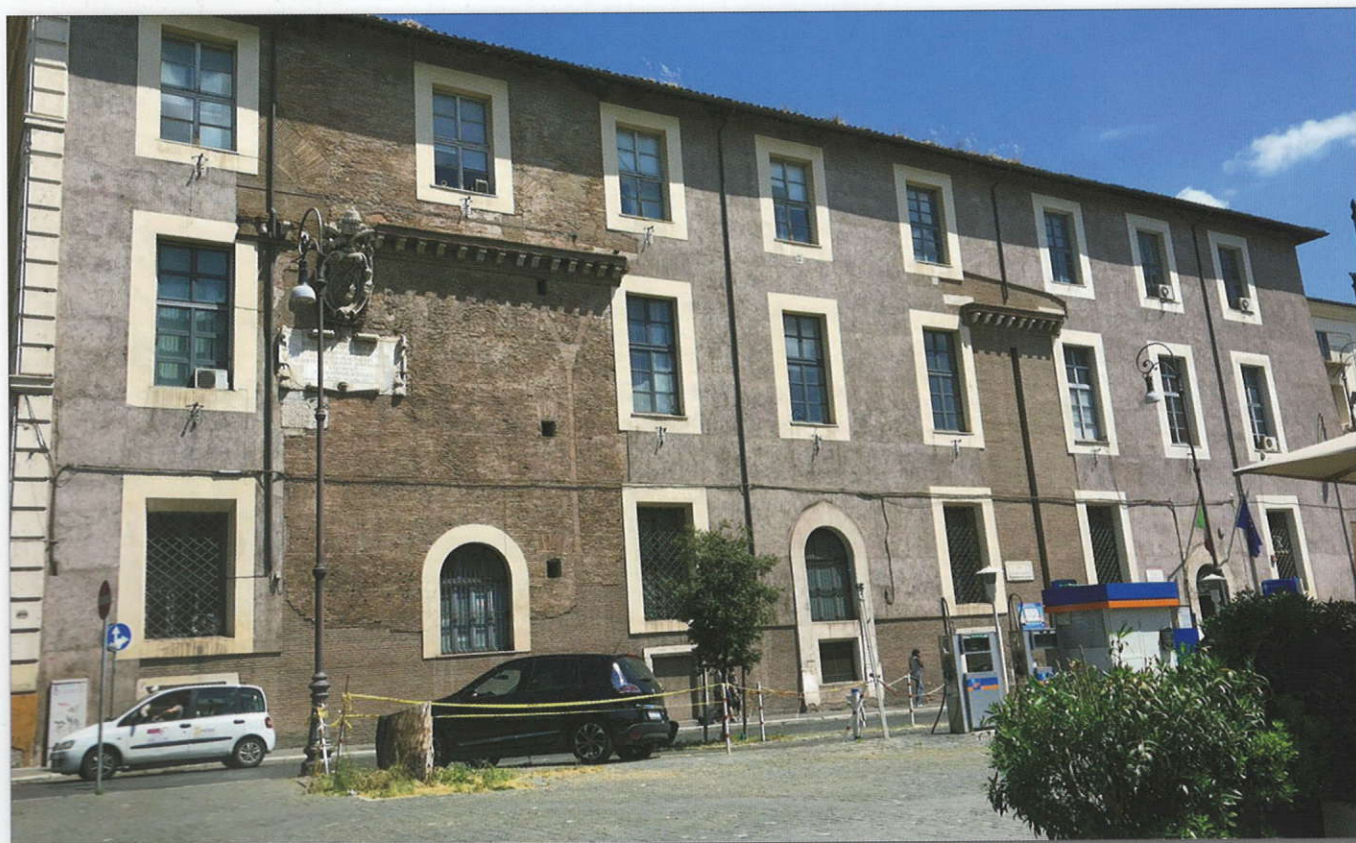
La sede del MuSEd a Roma in piazza della Repubblica n. 10.

Ecco perché, a partire da questo input , gli ultimi trent'anni di vita del MuSEd sono stati segnati da numerose acquisizioni di oggetti, arredi, opere d'arte, documentazione giuridico-legislativa, libri e riviste per bambini e ragazzi,