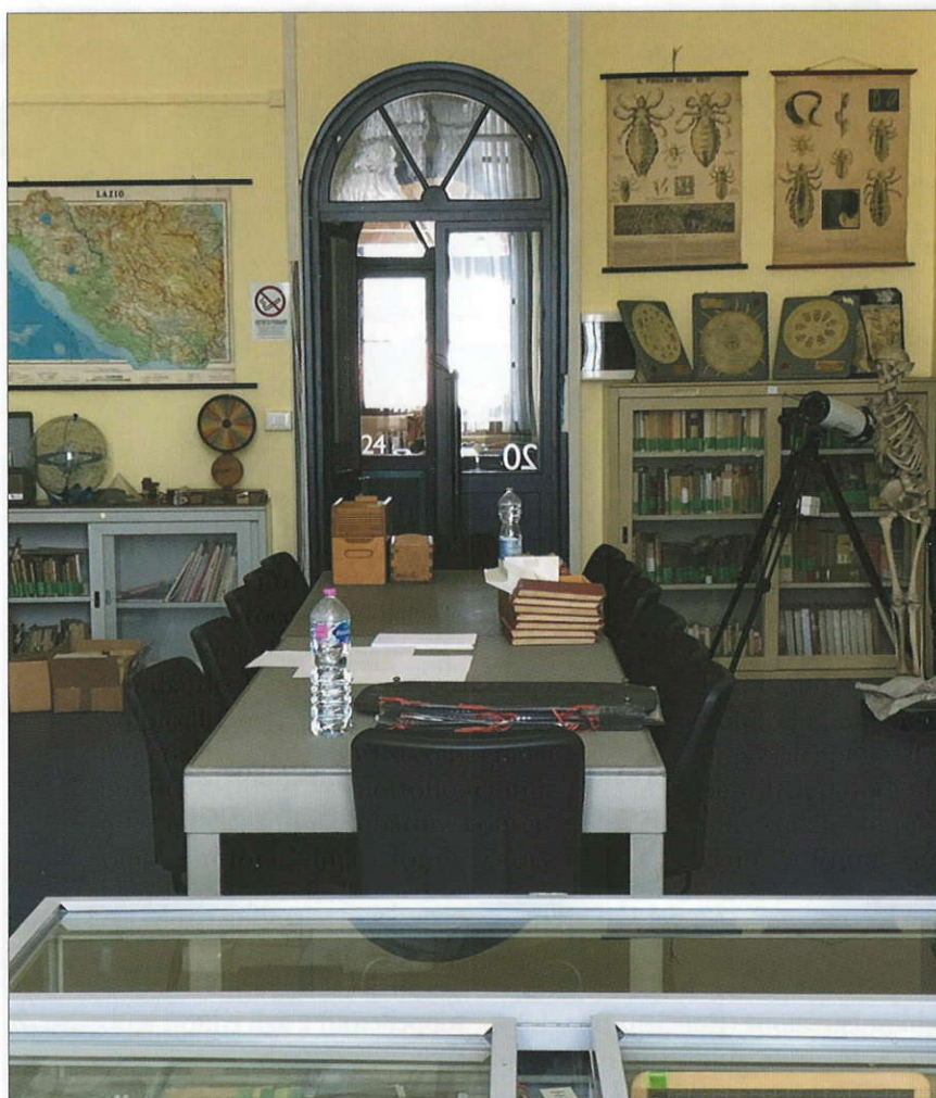
La sala di lettura del MuSEd.

All'interno di questo contenitore suggestivo e prestigioso, oggi il MuSEd ci si presenta come una sorta di wunderkammer che avrebbe solleticato la passione intellettuale e collezionistica di Walter Benjamin. Un inesauribile serbatoio di immagini, ovvero di narrazioni di storia sociale e di ambizioni teoriche, di fonti materiali e di itinerari intellettuali, di sicuro impatto emotivo per il visitatore. Ecco perché, come si evince anche dalle pagine che seguono, le potenzialità di sviluppo del MuSEd sono affidate sia alla sua