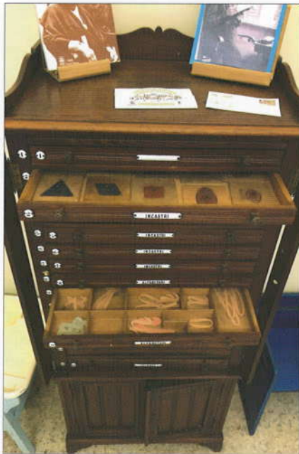
La cassettera progettata e fatta realizzare da Maria Montessori per contenere i materiali di sviluppo presso la prima Casa dei bambini a San Lorenzo, Roma 1907.

Nel 1898 partecipa al primo "Congresso pedagogico italiano" presentando i risultati del suo lavoro condotto presso la cli-