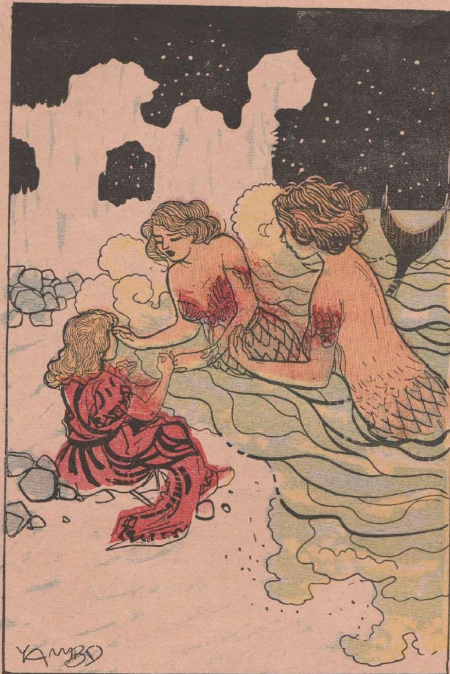
... Le due sirene parlano dolcemente alla bambina...