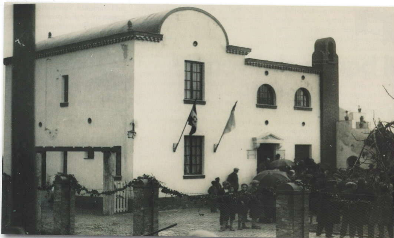
Inaugurazione della scuola di Scauri (1927).