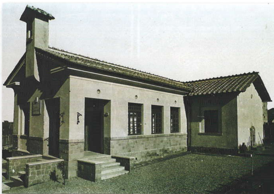
La scuola di Torre Spaccata (1926).