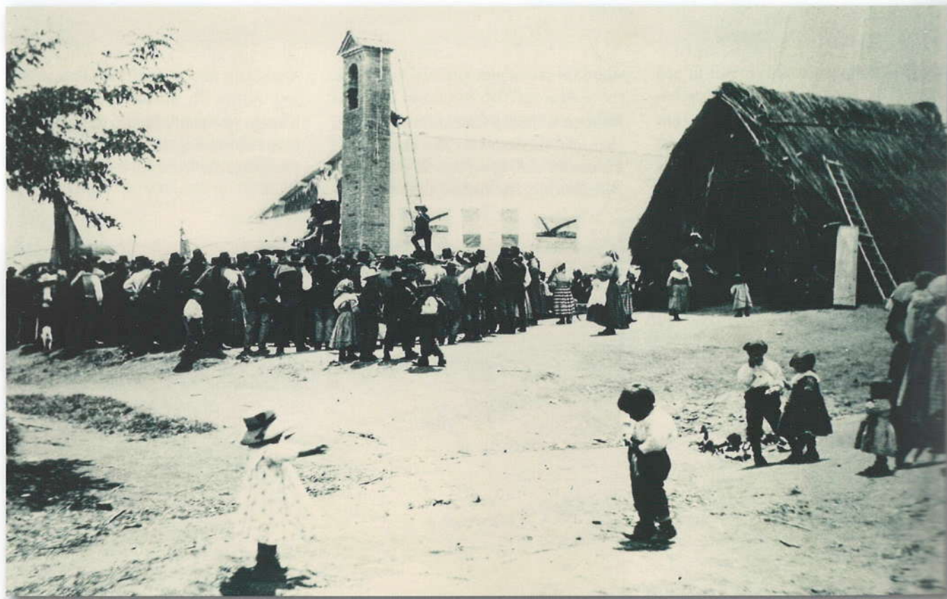
Inaugurazione della scuola a Colle di Fuori (1912).

La scuola venne costruita in più riprese: nel 1912 venne realizzato il primo nucleo e ampliata poi nel 1914 e nel 1924. Su progetto di Alessandro Marcucci, inizialmente comprendeva un ingresso, un corridoio, un locale principale di mq. 35 adibito ad aula e uno più piccolo di mq.10 destinato al