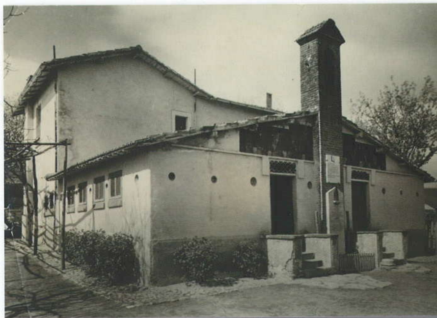
La scuola di Colle di Fuori (1924).

Il carattere celebrativo della costruzione aveva favorito la raccolta di fondi sufficienti a realizzare un complesso articolato: nella parte antistante dell'edificio, a un piano, erano situate due aule adiacenti di m. 6 x 7,5 – una per le classi elementari e una per l'asilo – che comunicavano col porticato a quattro arcate rivolto verso la via Appia,