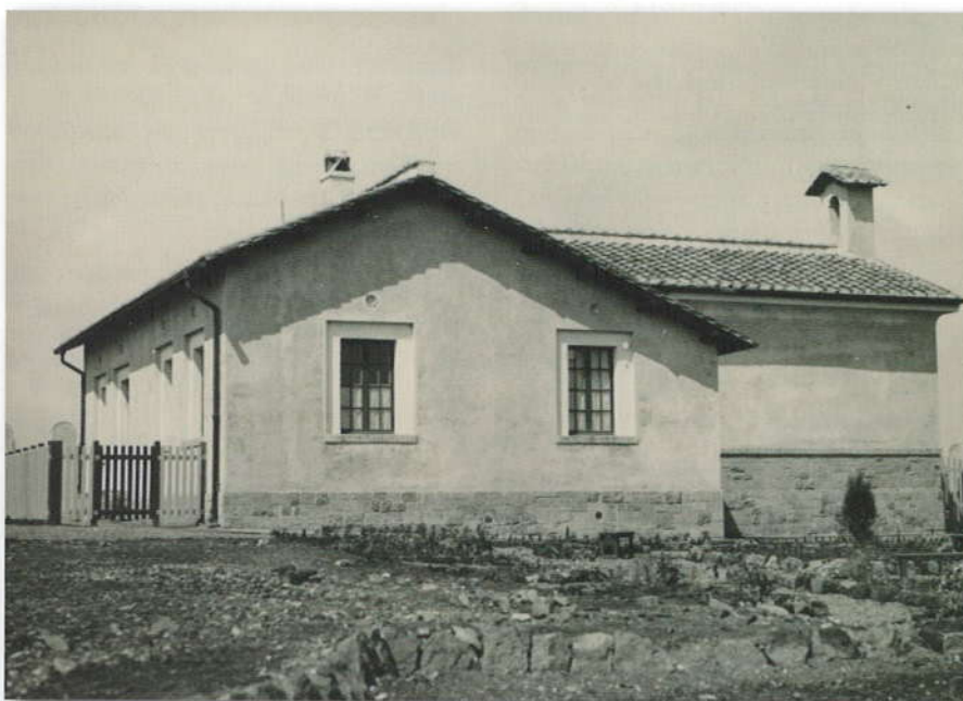
Prospetto laterale della scuola di Torre Spaccata.

completato da una torretta campanaria, ed erano illuminate da tre grandi finestre poste sui lati del fabbricato. La parte retrostante, a due piani, ospitava la direzione, la cucina, la dispensa, un vestibolo e i servizi igienici e al piano superiore l'alloggio per le insegnanti composto da tre camere, cucina, bagno e vestibolo, cui si accedeva attraverso una scala esterna. Nel terreno circostante, adibito alle esercitazioni agrarie, vennero