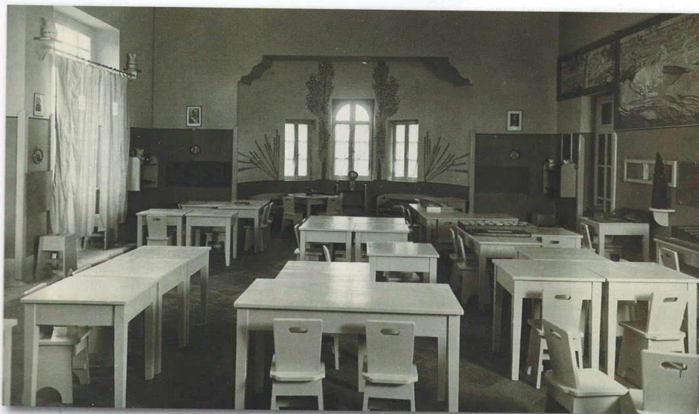
Interno dell'aula a Scauri.